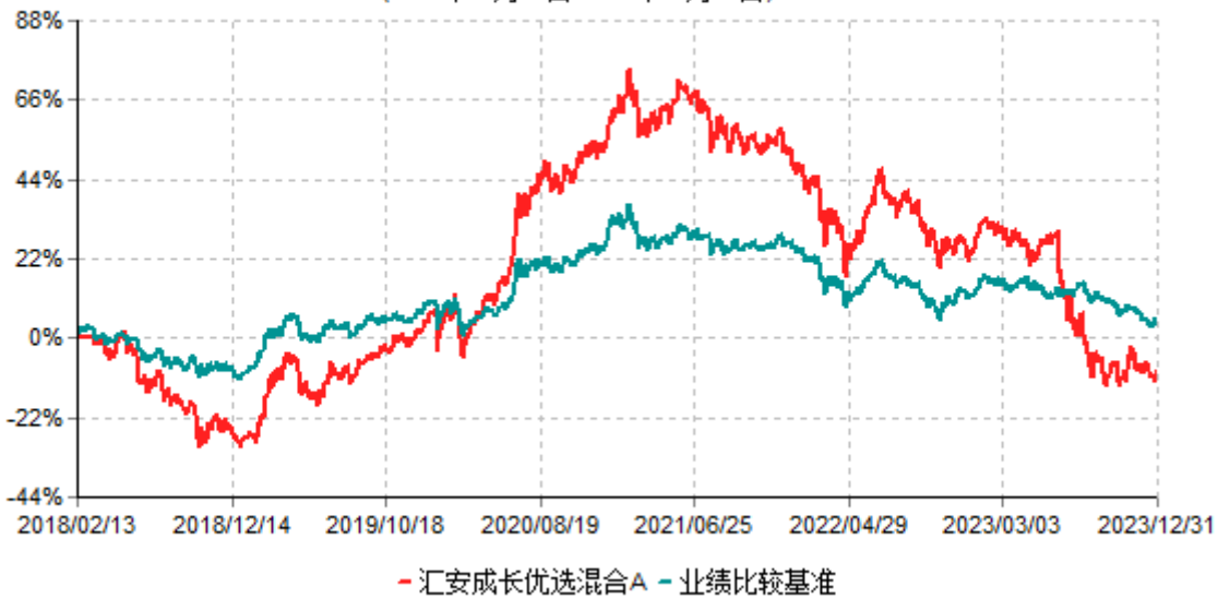
汇安成长优选混合A累计净值增长率与业绩比较基准收益率历史走势对比图 (2018年02月13日-2023年12月31日)