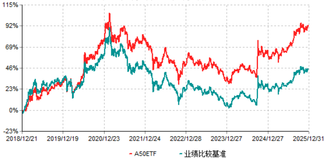
A50ETF累计净值增长率与业绩比较基准收益率历史走势对比图 (2018年12月21日-2025年12月31日)