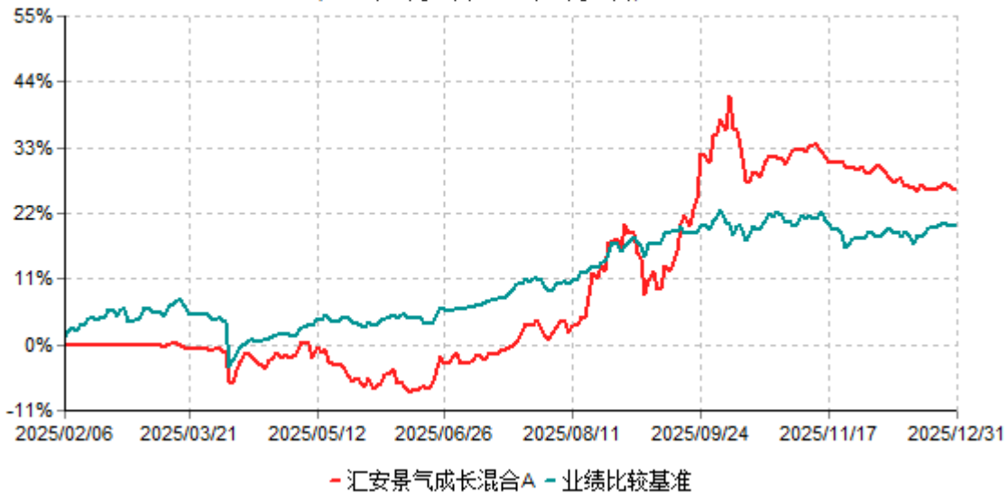
汇安景气成长混合A累计净值增长率与业绩比较基准收益率历史走势对比图 (2025年02月06日-2025年12月31日)