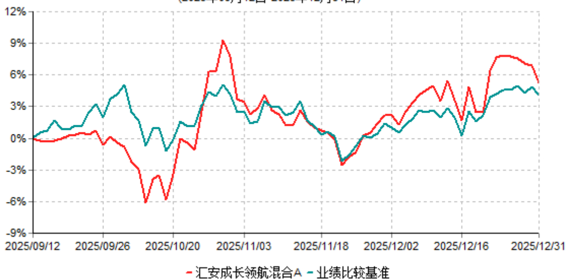
汇安成长领航混合A累计净值增长率与业绩比较基准收益率历史走势对比图 (2025年09月12日-2025年12月31日)